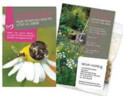
Attirer les auxiliaires (mélange PBI)