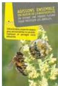
Nourrir les abeilles (mélange miellée annuelles)