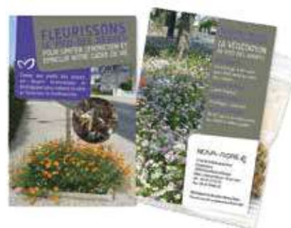
Fleurir les pieds d'arbres (mélange pied d'arbre)