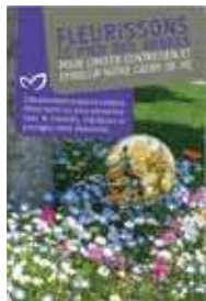
Fleurir le pied des arbres (mélange pied d'arbre)