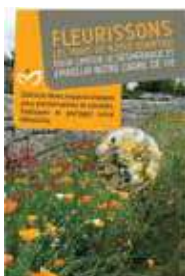
Réduire le désherbage (mélange pied de mur)