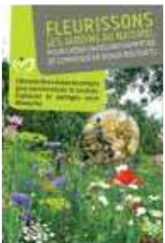
Fleurir le jardin (mélange fiesta)