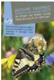
Préserver les papillons (mélange papillon)