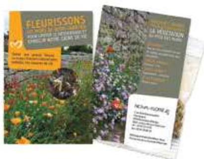
Réduire le desherbage (mélange pied de mur)

Un objet indispensable pour la communication quotidienne auprès des habitants. Disponible sur stock à partir de 100 ex.