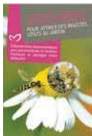
Attirer les auxiliaires (mélange PBI)