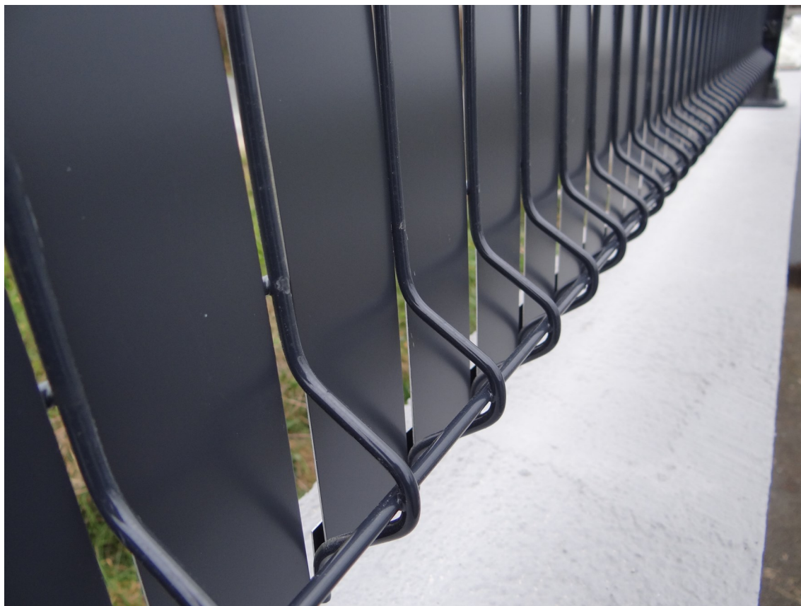
Vue face avant, sans pliage