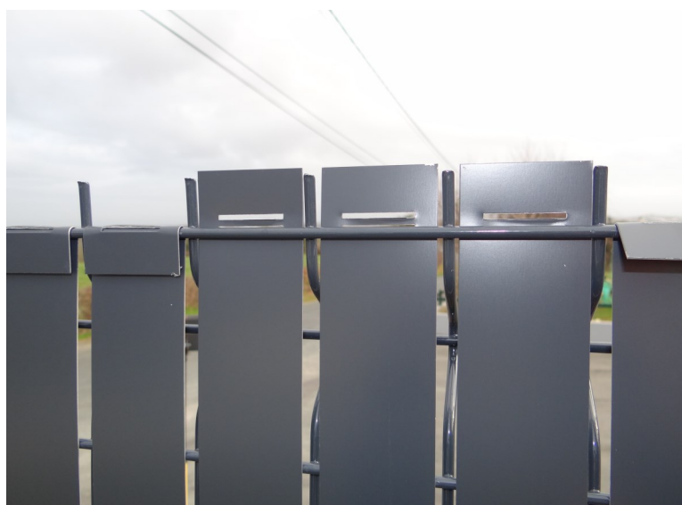
Pliage des extrémités hautes à l'arrière