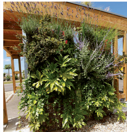
[ Juillet 2010 ]