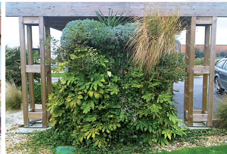
[ Novembre 2011 ]