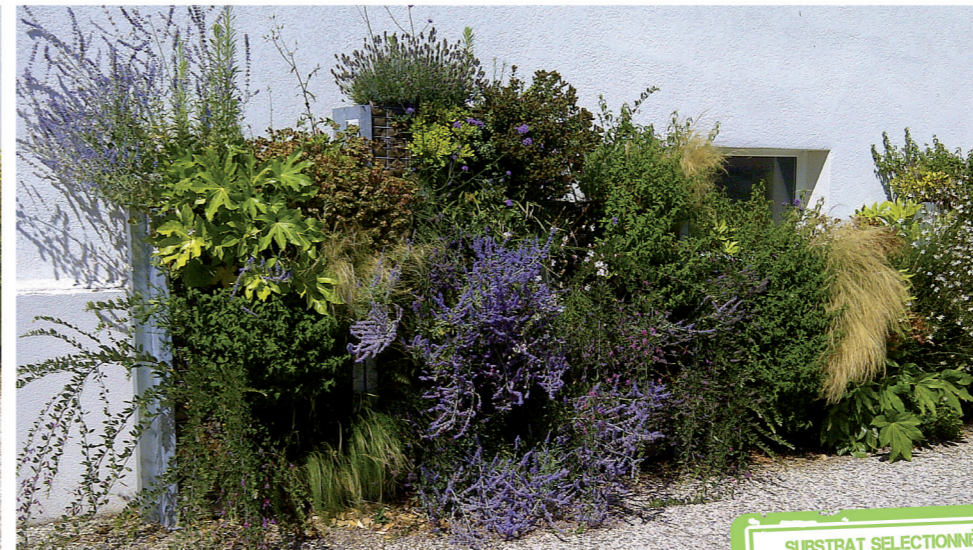
[ Aujourd'hui ]