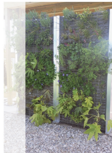
[ Mai 2010 : pose du mur ]