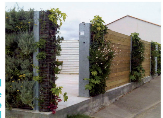
[ Local technique dans une résidence ]