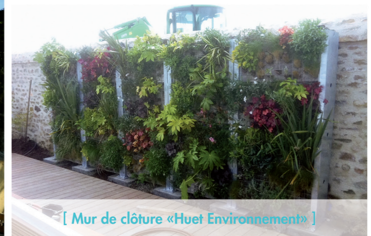
[ Mur de clôture «Huet Environnement» ]