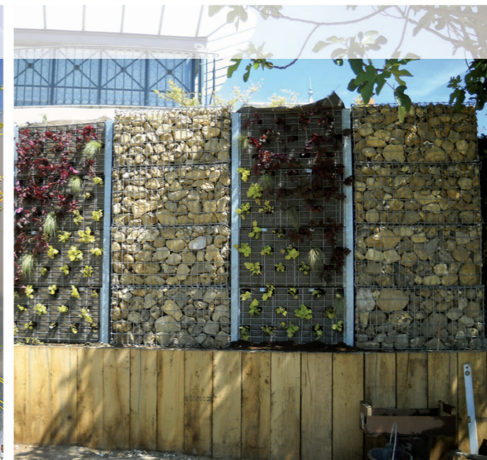
[ Mur de clôture «Bluteau Paysage» ]