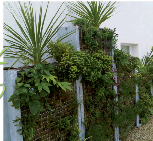
[ Avril 2011 : pose du mur ]