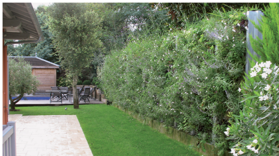
[ Mur de clôture «Les Paysages d'Antoine» ]